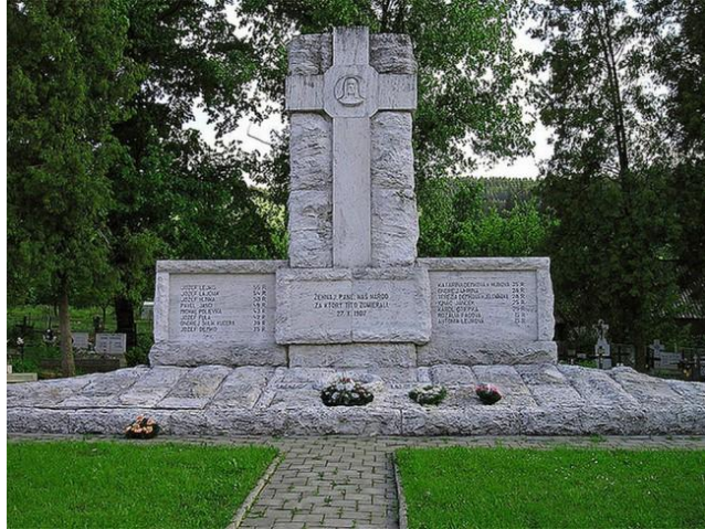
Pomník Černovskej tragédie

Silný vplyv maďarizácie vyvrcholil v roku 1907 udalosťou v Černovej . Chceli, aby tento kostol posvätil Andrej Hlinka, ktorý sa tam narodil. Následkom toho bol zbavený farského úradu. Obyvatelia nevpustili do dediny kňazov, ktorí mali posvätiť nový kostol a na pokyn žandára začali po dedinčanoch strieľať (zomrelo 15 ľudí) a mnohých ďalších ľudí postavili pred súd. Na obranu práv Slovákov sa konali protesty v Európe a aj v Amerike.