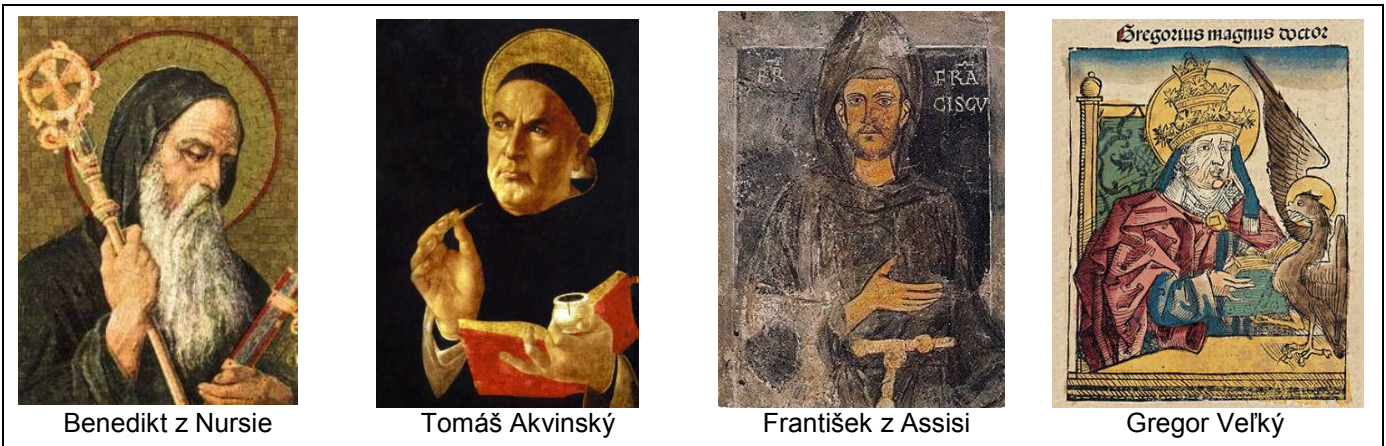
Benedikt z Nursie

Prvé kláštory zakladali benediktíni . Patrónom kultúry v Európe sa stal Benedikt z Nursie . Po Benediktínoch začali šíriť vzdelanosť rád dominikánov . Medzi nich patril aj najznámejší učenec stredoveku Tomáš Akvinský . Ďalším stredovekým rádom boli františkáni . Založil ich František z Assisi , ktorý sa venoval službe chudobným. Mnísi a kňazi boli až do 12. storočia takmer jedinými európskymi vzdelancami . V 10. storočí pôsobil vzdelaný pápež Gregor Veľký , ktorý sa zaslúžil o rozvoj hudby (gregoriánsky chorál) a vytvoril kalendár.