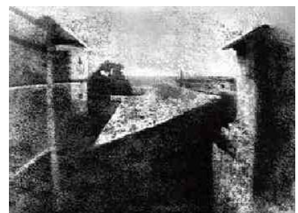
najstaršia zachovaná fotografia

Informácií je veľa a preto ich musíme triediť na dôležité a zbytočné a musíme vedieť zhodnotiť ich pravdivosť.